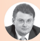
ЕВГЕНИЙ ФЕДОРОВ, депутат Государственной Думы:

– США десятилетиями готовят у себя политическую элиту для России. Через их разные программы прошло порядка 90% представителей российской власти. Просто так на их курсы не попасть. Американцы сами вербуют здесь кандидатов, в которых уверены, что они будут служить интересам США. Эти американские агенты могут иметь разные красивые образы. Они могут маскироваться под кого угодно. В этом и логика любого агента – добиться результата путём маскировки. В том числе маскировкой под «патриота».